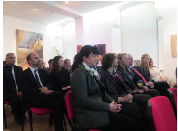
Vue de l'assistance

expliquant les particularités de ce quartier, il a insisté sur le sens de cette maison en tant que lieu d'explication de ce que fut ce quartier au cours de ses 800 ans d'histoire. Il a de plus exposé les différentes parties du projet (côté muséal, exposition de clichés d'Hermann Burchardt sur les juifs de Fès en 1900, création d'une coopérative de femmes du quartier pour la confection de pâtisseries juives qui seront proposées aux visiteurs de la maison).