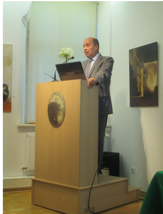
L'ambassadeur du Maroc en RFA, Monsieur Omar Zniber, lors de sa présentation de l'évènement

fédéraux allemands ainsi que des membres du corps diplomatique accrédités à Berlin.